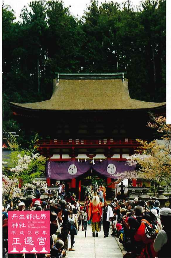
花盛祭(丹生都比売神社)